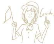
N1合格 日本語学科2年 ソウ・シルイ