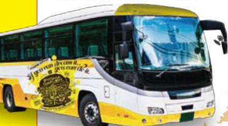
※バスはイメージです。